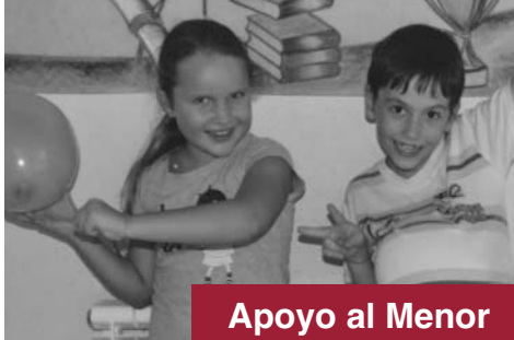
Apoyo al Menor