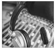
PROGRAMAS DIOCESANOS COPE Aquí podréis volver a escuchar lo que queráis y descargar los programas.