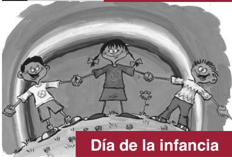
Día de la infancia