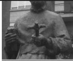
Zamora celebra a San Alfonso 25 años después de su canonización