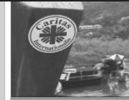
Cáritas Diocesana de Zamora, también con Filipinas