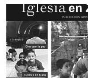
HOJA DIOCESANA "ZAMORA" Aquí podréis descargar y leer las Hojas Diocesanas en formato PDF.