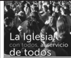
La Iglesia diocesana de Zamora: con todos y al servicio de todos