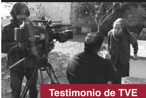
Testimonio de TVE

PUBLICACIÓN QUINCENAL DE LA DIÓCESIS DE ZAMORA