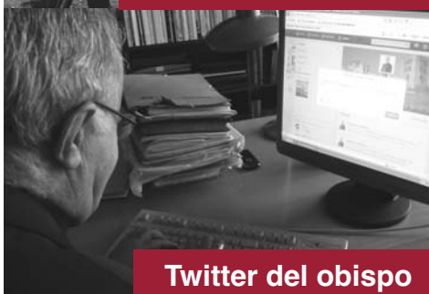
Twitter del obispo