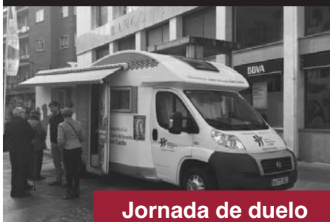
Jornada de duelo

PUBLICACIÓN QUINCENAL DE LA DIÓCESIS DE ZAMORA