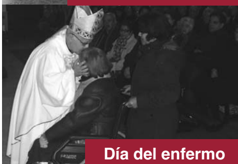
Día del enfermo