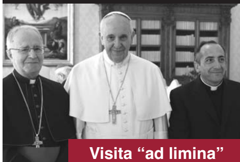
Visita "ad limina"

PUBLICACIÓN QUINCENAL DE LA DIÓCESIS DE ZAMORA