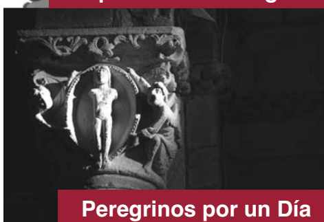
Peregrinos por un Día