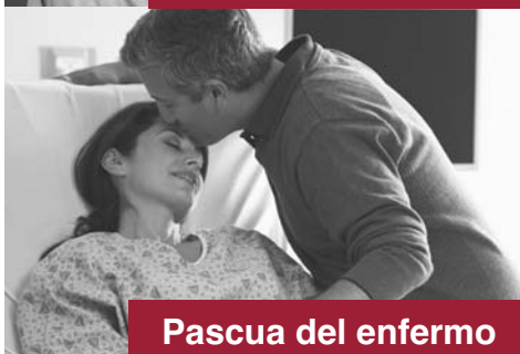
Pascua del enfermo