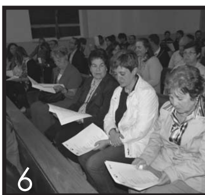
1. Peregrinos por un Día entre Carbajales de Alba y Videmala (17-5) 2. Confirmaciones en Coreses (11-5) 3. Cáritas en la Feria de Voluntariado de Zamora (16-5) 4. El coro "Diego de Torres Bollo" de Villalpando en el Festival de la Canción Misionera (4-5) 5. Jornadas sobre empobrecimiento comunitario (14-5) 6. Vigilia "Enlázate por la justicia" (13-5)