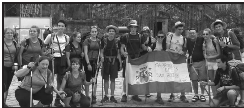
Final del Camino de Santiago de los jóvenes de las parroquias de la Unidad Pastoral de Sanzoles (17-7)