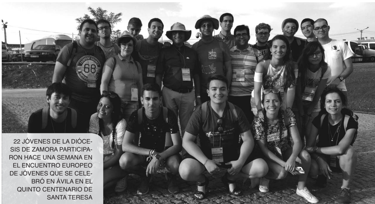
22 JÓVENES DE LA DIÓCESIS DE ZAMORA PARTICIPARON HACE UNA SEMANA EN EL ENCUENTRO EUROPEO DE JÓVENES QUE SE CELEBRÓ EN ÁVILA EN EL QUINTO CENTENARIO DE SANTA TERESA