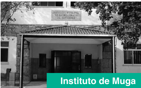
Instituto de Muga