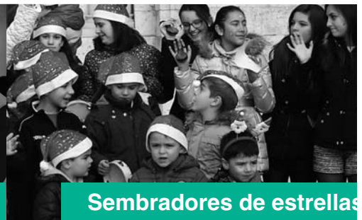
Sembradores de estrellas