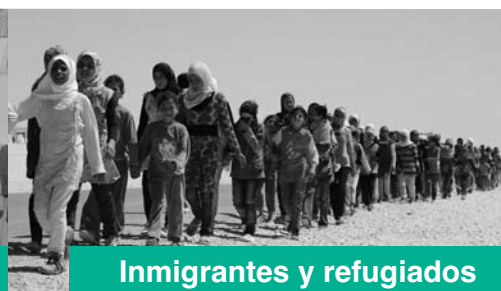
Inmigrantes y refugiados