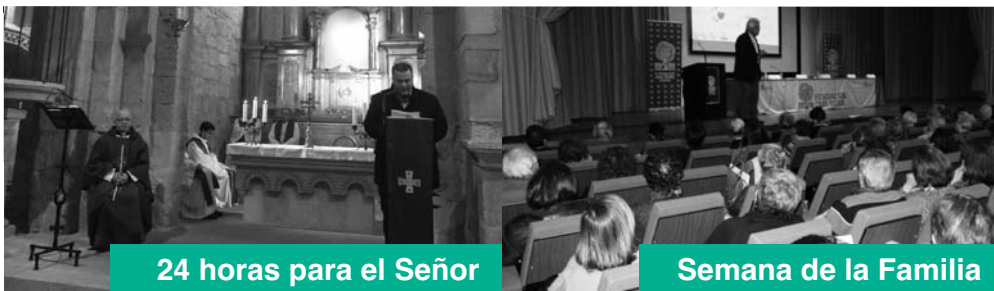
24 horas para el Señor