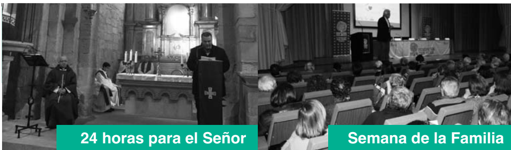
24 horas para el Señor