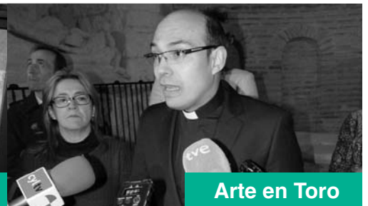
Arte en Toro