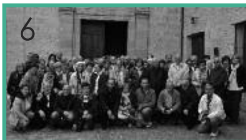
6. Encuentro regional de Misiones en Toro (16-6) 7. Aula regional de catequistas en Toro (1/2-7) 8. Confirmaciones en Santa María, de Benavente (22-6)