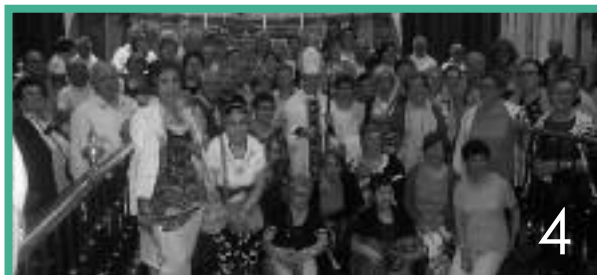
4. Jubileo del arciprestazgo de Benavente-Tierra de Campos (10-6)