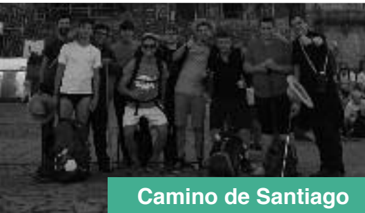
Camino de Santiago