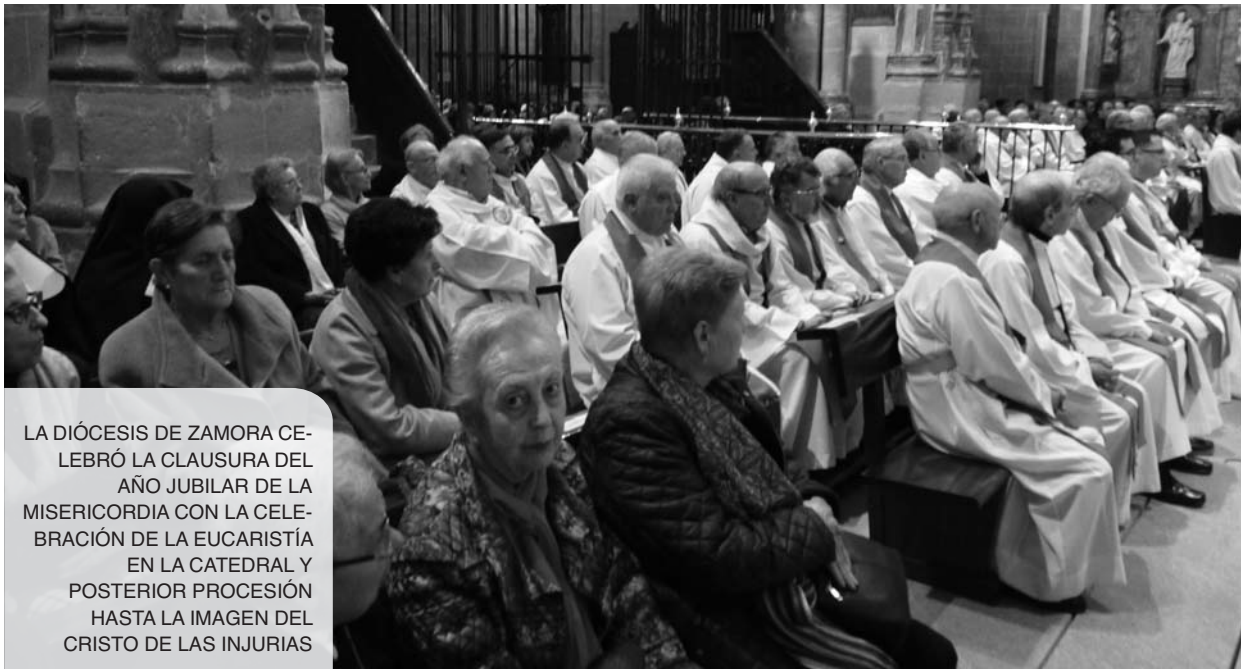
LA DIÓCESIS DE ZAMORA CELEBRÓ LA CLAUSURA DEL AÑO JUBILAR DE LA MISERICORDIA CON LA CELEBRACIÓN DE LA EUCARISTÍA EN LA CATEDRAL Y POSTERIOR PROCESIÓN HASTA LA IMAGEN DEL CRISTO DE LAS INJURIAS