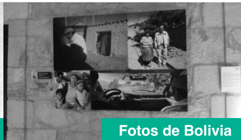
Fotos de Bolivia