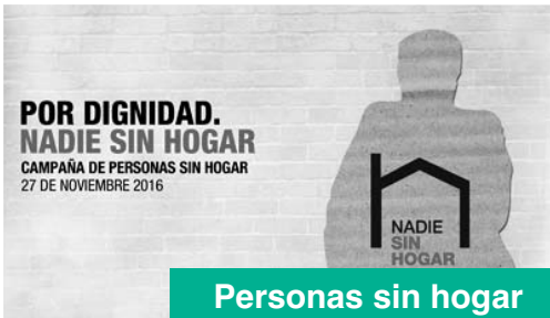
Personas sin hogar