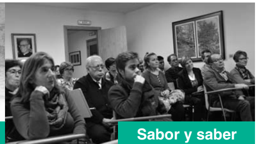
Sabor y saber