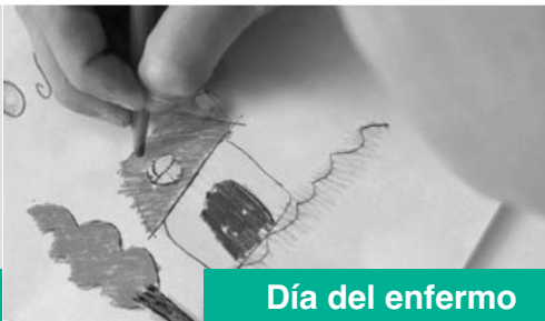
Día del enfermo