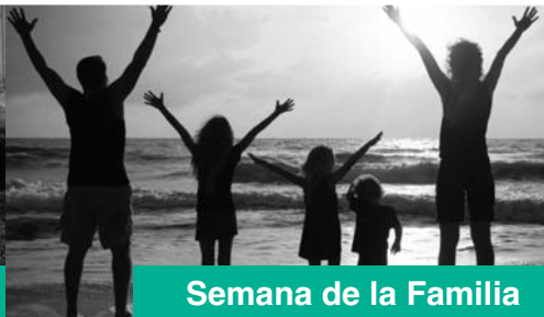
Semana de la Familia