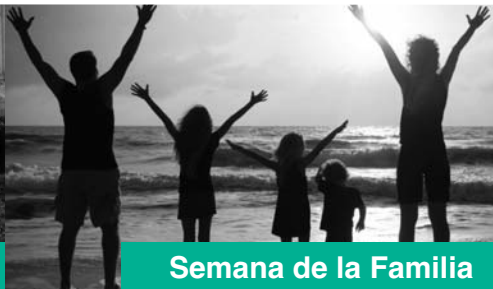
Semana de la Familia