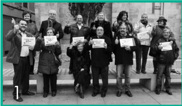
1. Flashmob de Encuentro Matrimonial en Zamora (11-2)