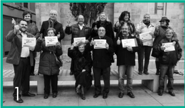
1. Flashmob de Encuentro Matrimonial en Zamora (11-2)