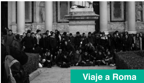
Viaje a Roma