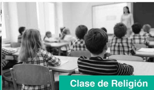
Clase de Religión