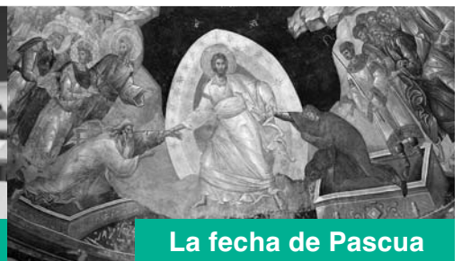
La fecha de Pascua