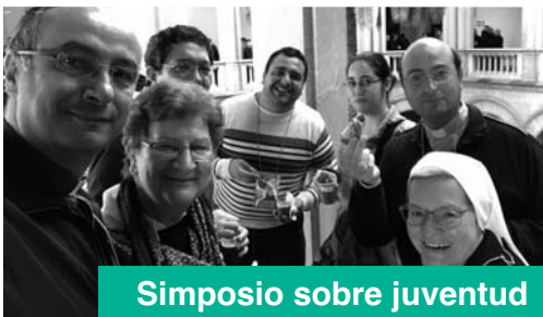
Simposio sobre juventud