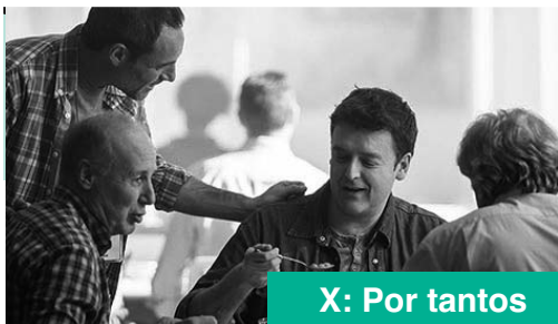
X: Por tantos

EMPUJADOS POR EL ESPÍRITU: “AQUÍ ESTOY, ENVÍAME”