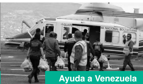
Ayuda a Venezuela