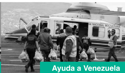
Ayuda a Venezuela