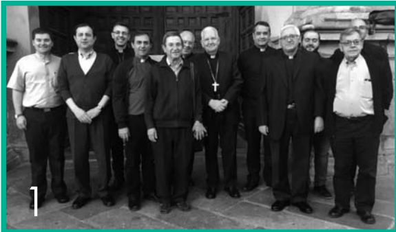
1. Reunión de delegaciones de Liturgia de la región en Segovia (5-6) 2-3. Convivencia de fin de curso de la catequesis de las parroquias de Toro, en Renedo de Esgueva (10-6)