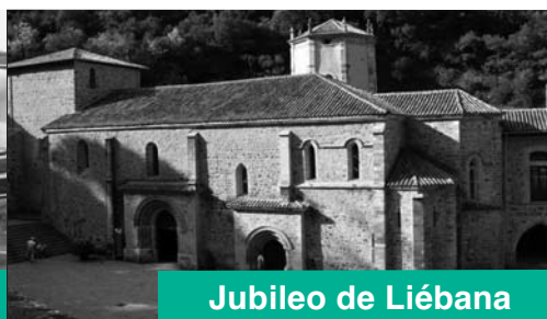
Jubileo de Liébana