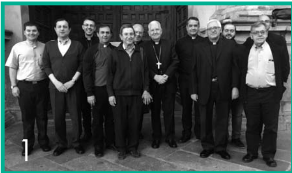
1. Reunión de delegaciones de Liturgia de la región en Segovia (5-6) 2-3. Convivencia de fin de curso de la catequesis de las parroquias de Toro, en Renedo de Esgueva (10-6)