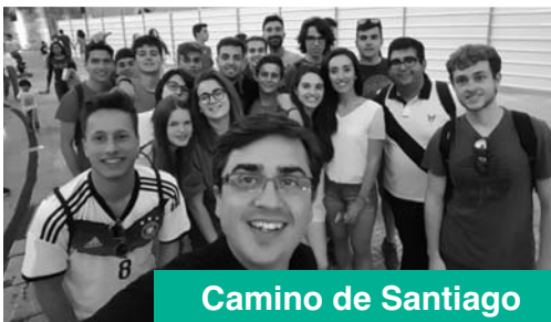
Camino de Santiago

JÓVENES ZAMORANOS EN MISIÓN: ANGOLA Y BOLIVIA