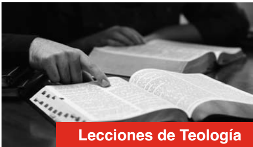
Lecciones de Teología