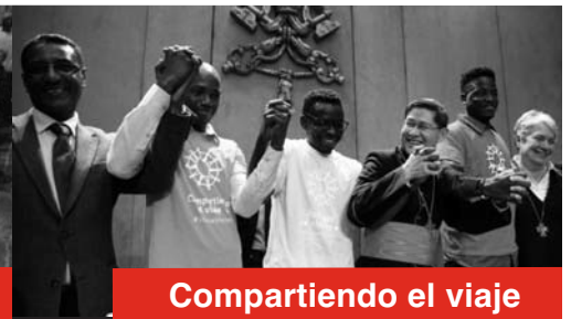
Compartiendo el viaje