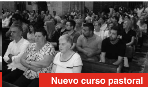
Nuevo curso pastoral