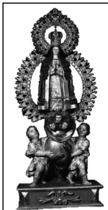
imagen pasó al altar mayor. En 1933, al caerse la iglesia, la imagen se llevó a S. Nicolás de Bari, donde se había hecho el Voto en 1466.