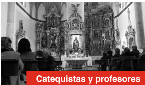
Catequistas y profesores