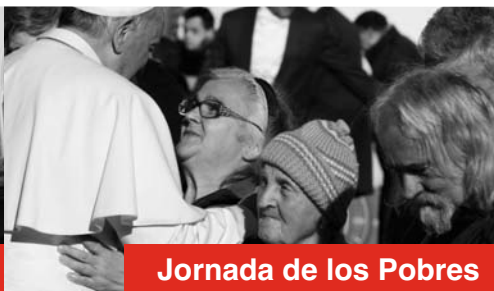
Jornada de los Pobres