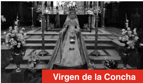
Virgen de la Concha