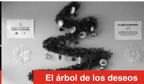
El árbol de los deseos