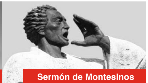
Sermón de Montesinos