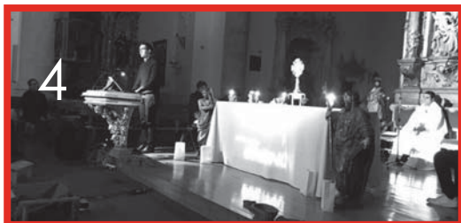
1-3. Fotos de familia y de la Misa del Día del Seminario (18-3) 4. Vigilia de oración por las vocaciones sacerdotales (16-3)