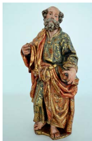
Juan de Montejo