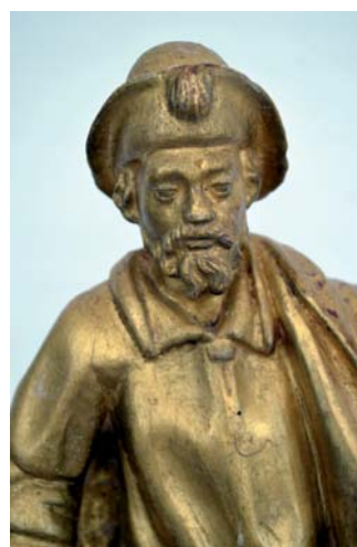
Gaspar de Acosta