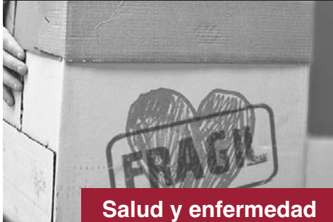
Salud y enfermedad

PUBLICACIÓN QUINCENAL DE LA DIÓCESIS DE ZAMORA