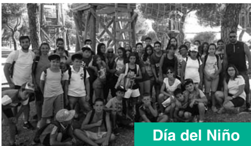
Día del Niño