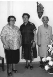
COMUNIDAD DE TRINITARIAS DE ZAMORA

Nos ubicamos en un barrio de la periferia, porque las necesidades coincidían con nuestro carisma. Llegamos tres hermanas, que más tarde fueron aumentando. Hoy somos tres y estamos jubiladas. Seguimos insertadas en la parroquia, según nuestras posibilidades y trabajamos en catequesis, pastoral de enfermos y Cáritas parroquial. Administramos la Santa Comunión a domicilio y a la residencia de ancianos, visitamos y acompañamos a familias del barrio, según las necesidades sociales, viviendo desde la Comunidad el amor trinitario con espíritu de servicio.