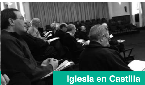
Iglesia en Castilla