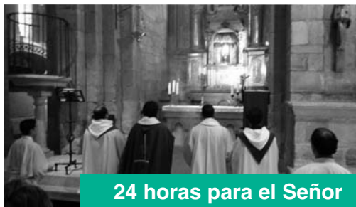
24 horas para el Señor