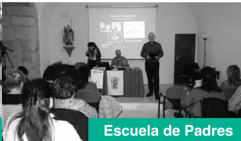
Escuela de Padres