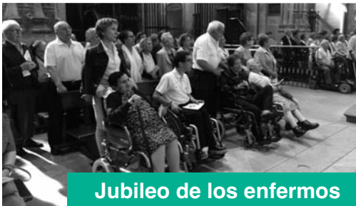
Jubileo de los enfermos