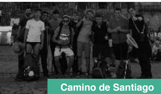
Camino de Santiago