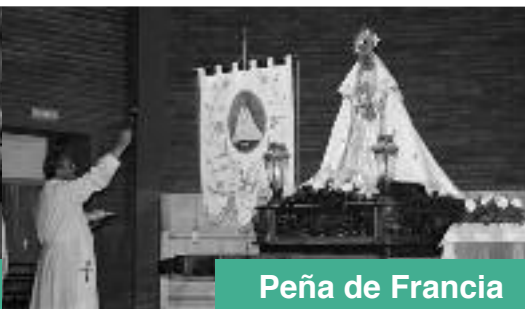
Peña de Francia