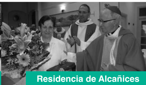
Residencia de Alcañices