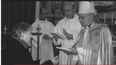
Profesores y catequistas

PUBLICACIÓN QUINCENAL DE LA DIÓCESIS DE ZAMORA