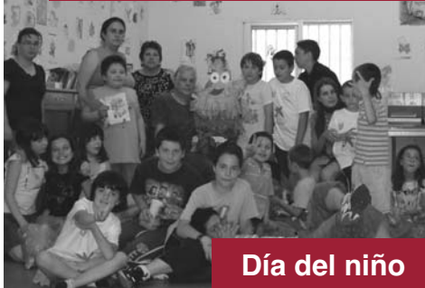
Día del niño