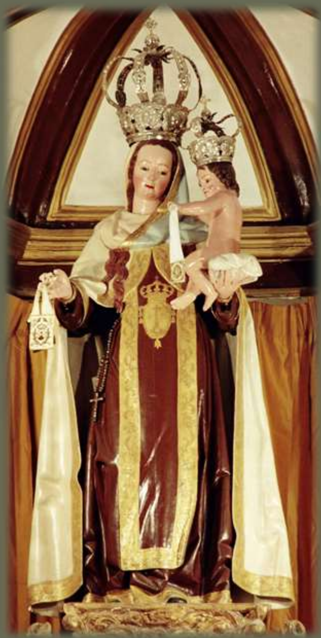
Virgen del Carmen

Grupo escultórico en madera tallada, policromada y dorada