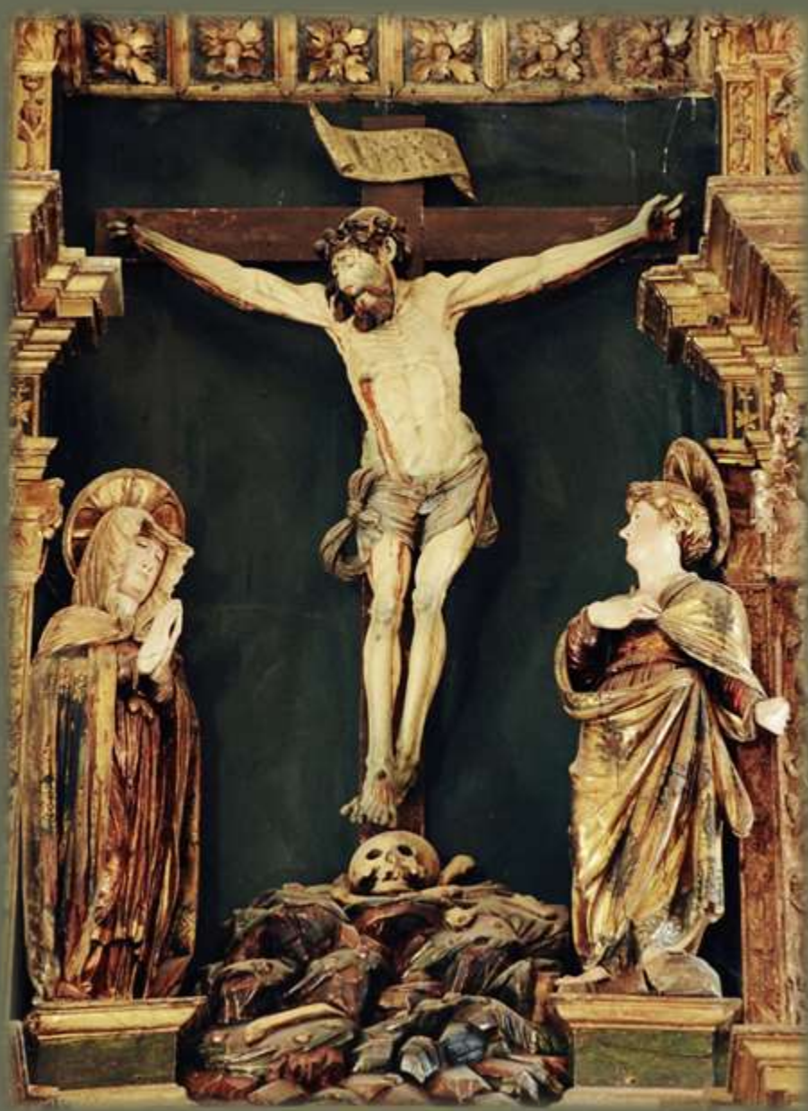
Calvario (Cristo crucificado, Virgen dolorosa y “discípulo amado”)

Grupo escultórico en madera tallada, policromada, dorada y estofada