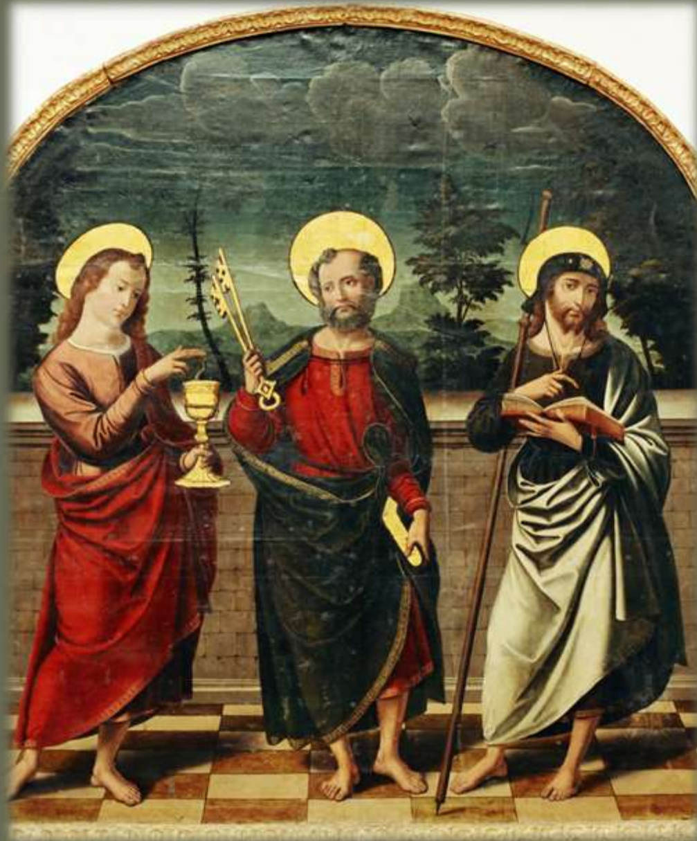
San Pedro, Santiago el Mayor y San Juan Evangelista